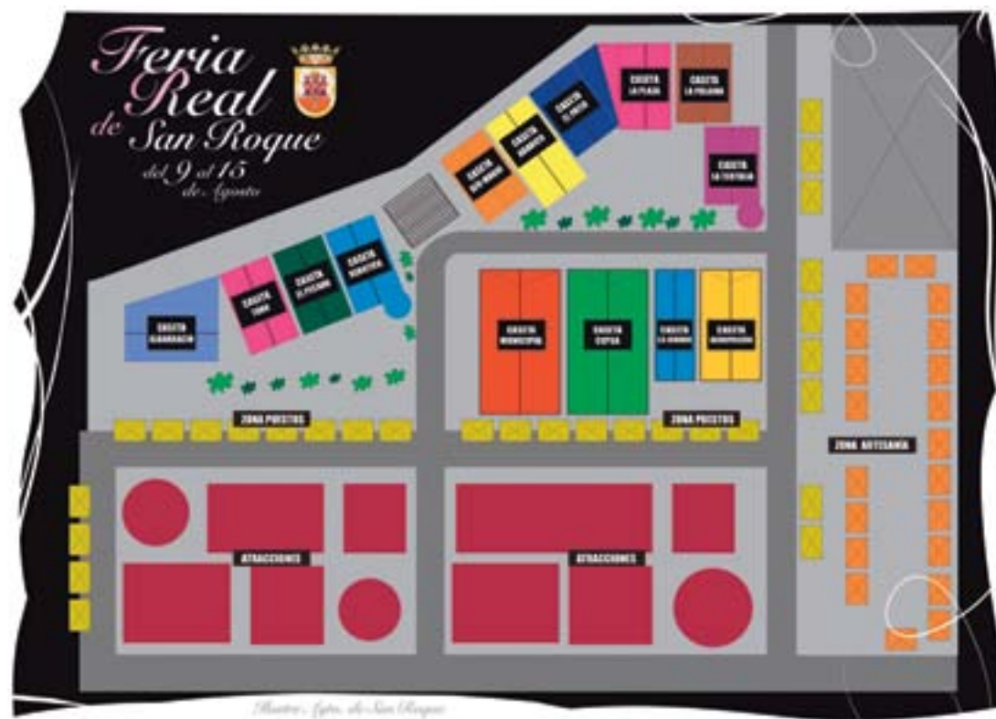
Ilustración: fotos de San Roque

En este año recordaremos vivencias, un viaje por sentir emociones de ayer, por descubrir las distintas ferias de San Roque, con el sabor del pasar del tiempo presente en nuestra mente, en nuestro corazón, al sonido de un clic de una cámara de fotos que inmortaliza un momento que no olvidaremos.