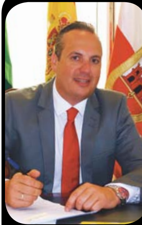
Juan Carlos Ruiz Boix Alcalde de San Roque