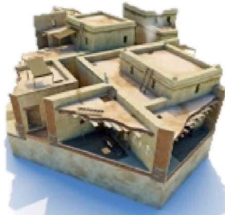
Reconstrucción de las casa fenicias

Las calles fueron pavimentadas con arcilla desde que se construyeron los primeros edificios. Posteriormente - debido a la acumulación de basura que se vertía directamente a la calle - tuvieron que volver a pavimentarse. Es muy interesante como todavía se puede ver muchas huellas fosilizadas de varios bóvidos, que recorrieron estas calles.