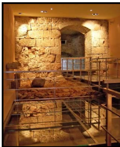
Restos romanos y fenicios de la Casa del Obispo

Durante época romana fue un gran santuario medicinal o salutífero, relacionado con los cultos a los dioses Apolo, Esculapio e Hygia, del que se conserva parte de uno de sus templos y de una gran galería subterránea, entre otras muchas construcciones. En el siglo XVI, el Obispo García de Haro lo convierte en residencia episcopal.