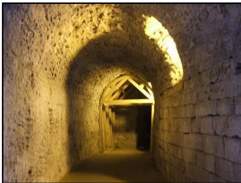
Galería del teatro romano

Es considerado como uno de los mayores teatros romanos de Hispania. En el Museo de Cádiz se conservan parte de su rica decoración en mármol.