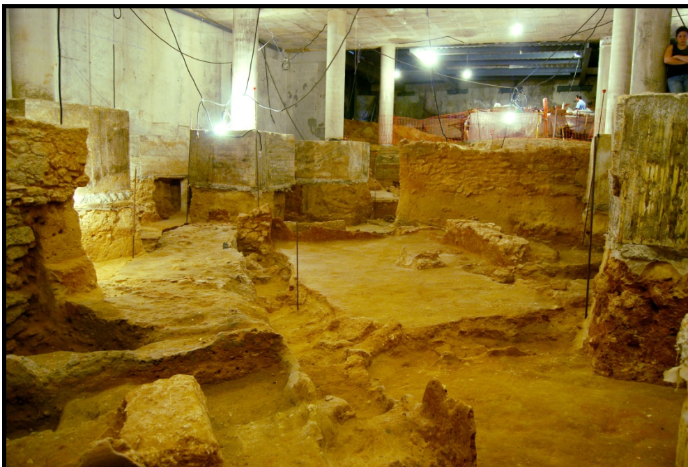
Vista general del yacimiento en proceso de puesta en valor

En los sótanos del actual teatro se conservan un total de ocho viviendas distribuidas en dos terrazas y organizadas en torno a dos calles pavimentadas. Todas estas construcciones han sido realizadas siguiendo lo que se denomina arquitectura de la tierra, es decir realizadas principalmente con barro y arcilla.