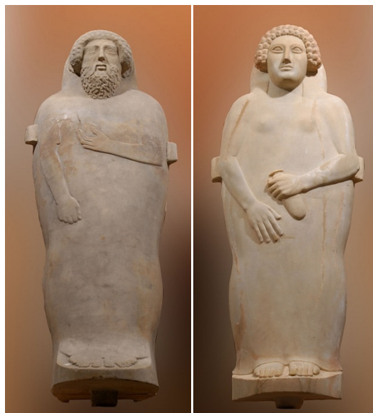
Sarcófagos antropoides. Siglo V a.C. (Museo de Cádiz).

Además de estos dos yacimientos en el Museo de Cádiz se puede contemplar, en una de sus salas, una amplia representación de piezas arqueológicas de diferentes períodos históricos, de las que destacan los sarcófagos antropoides, bronce dedicados al dios Melqart, exvotos de terracota, numerosos ajuares funerarios con una amplia colección de joyería fenicia y un gran conjunto de estatuaria romana.