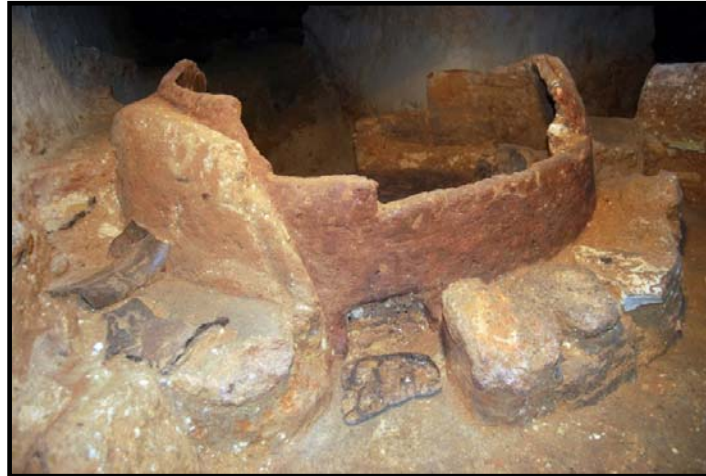
Detalle de un horno de pan de una de las viviendas

En una de las viviendas tiene un taller de alfarería, donde se han hallado restos de un torno de alfarero, grandes recipientes rellenos de tinte y utensilios de hueso y marfil para la decoración de la cerámica.