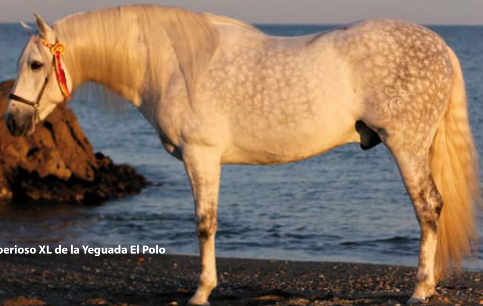
Imperioso XL de la Yeguada El Polo