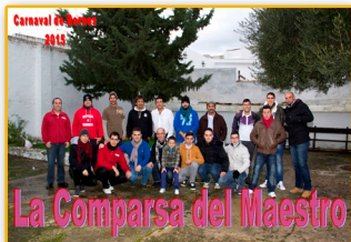
LA COMPARSA DEL MAESTRO