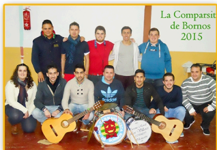
LA COMPARSITA DE BORNOS "EMBRUJO CALLEJERO"