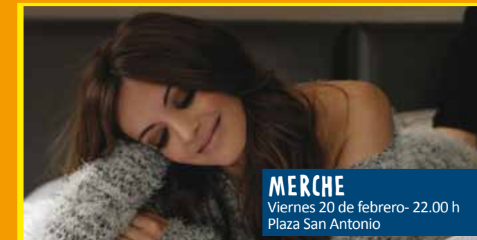
MERCHE Viernes 20 de febrero- 22.00 h Plaza San Antonio