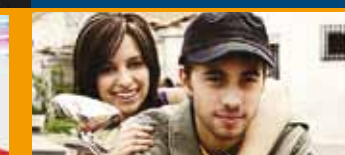
KIKO Y SHARA Jueves 19 de febrero- 22.00 h Plaza San Antonio