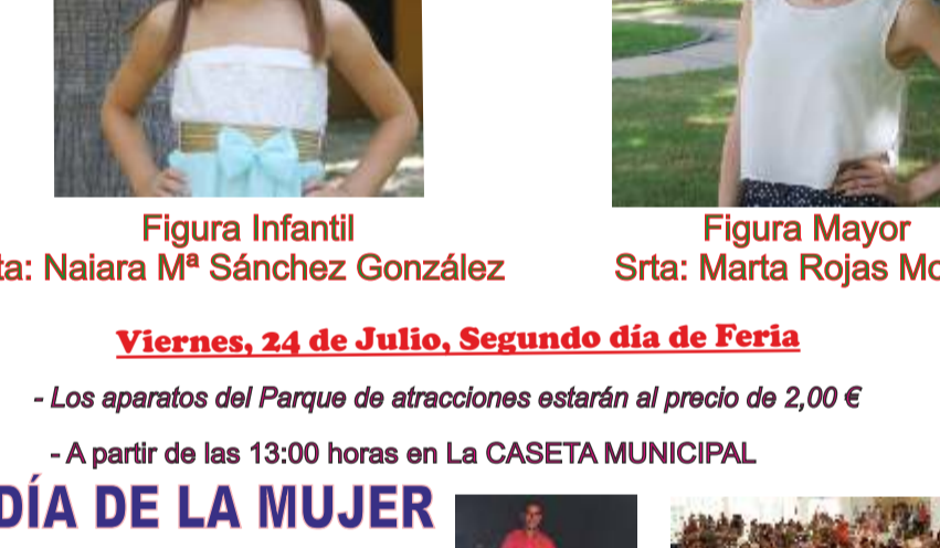
Damas Infantiles, de Izquierda a derecha:

* Bailes amenizados por el Grupo "SINFONÍAS DEL SUR"