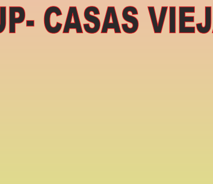
LA BELLA ORQUESTA

- A partir de las 23:30 horas en la ZONA JOVEN