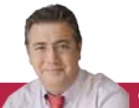
Juan Ignacio Zoido