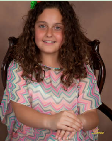
Nerea Varo Reyes