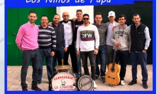
CHIRIGOTA "Los Niños de Papá"