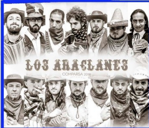
COMPARSA "Los Araclanes"