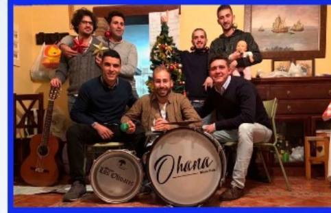
CHIRIGOTA "Los Barra Bravas"