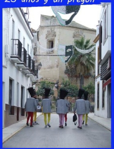
SHARANGA "25 años y un pregón"