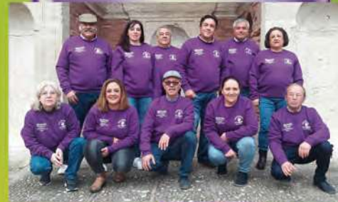
Entre derrape y curvatura las figurillas para la angostura Chirigota