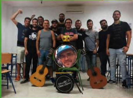
Los BO-Chevique Chirigota