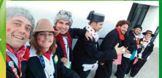
Los Lazarillos... no vea qué ciego chiquillo Chirigota