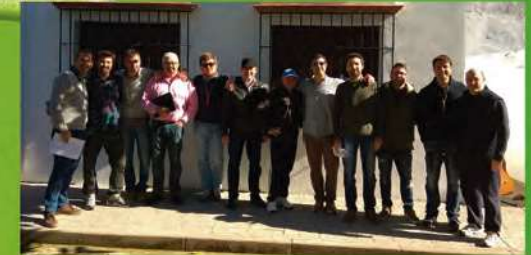
Los Maletillas La Murga de Bornos