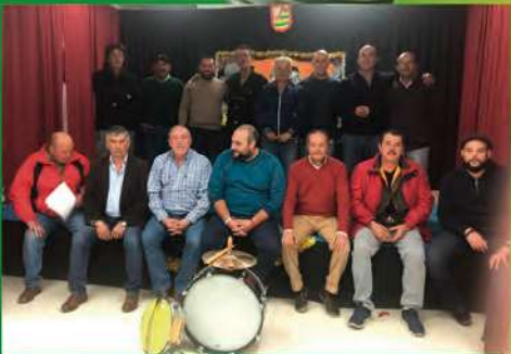
Los YaSon Sais Romancero