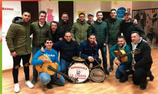
Una historia interminable Comparsa