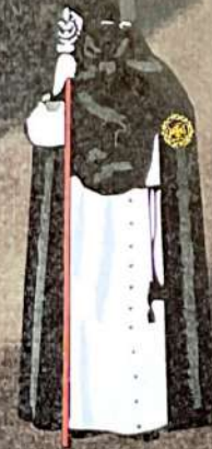
SANTO ENTIERRO Viernes Santo

EDITA: Excmo. Ayuntamiento de Olvera - TIRADA: 3000 ejemplares TEXTOS: Las Hermandades IMPRIME: Losagraf-Imprenta Digital