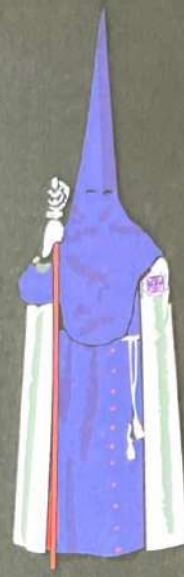
PADRE JESÚS Jueves Santo-Madrugá