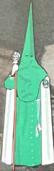
VERA+CRUZ Jueves Santo