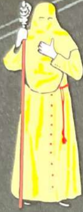
CAUTIVO Lunes Santo