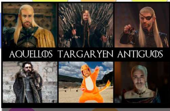
AQUELLOS TARGAYEN ANTIGUOS