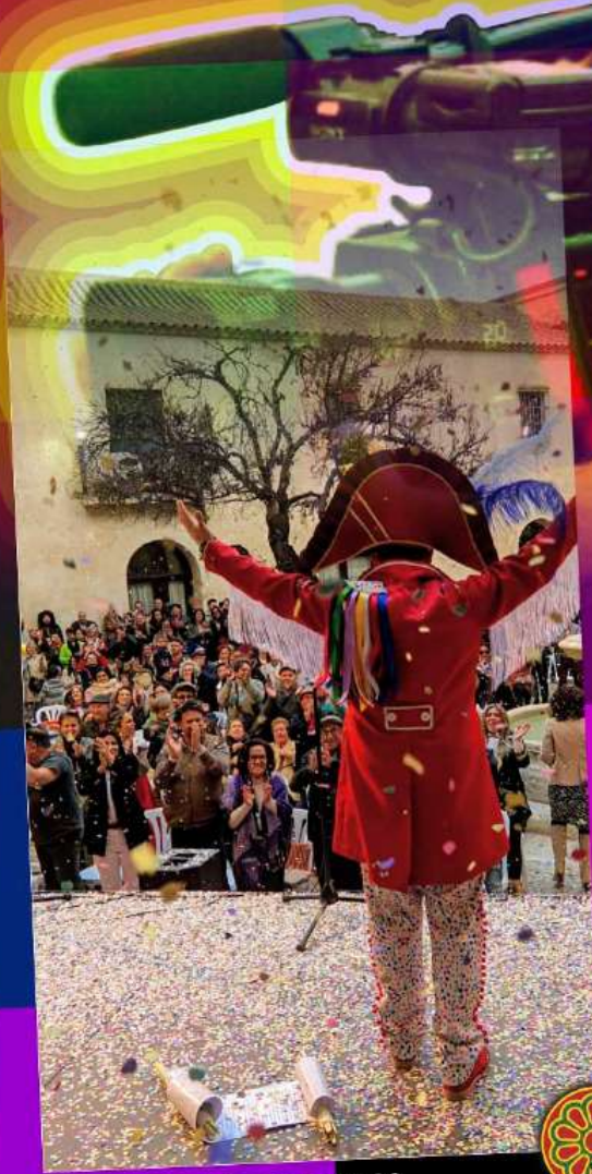
Premio mejor fotografía 2023. Autor: ÁLVARO GORDILLO MACIAS.