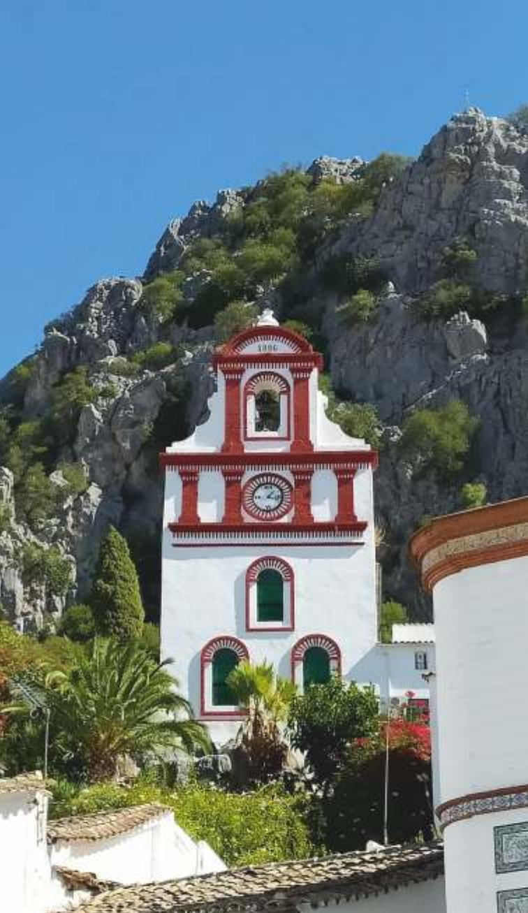
Iglesia y Mirador ERMITA DE SAN ANTONIO