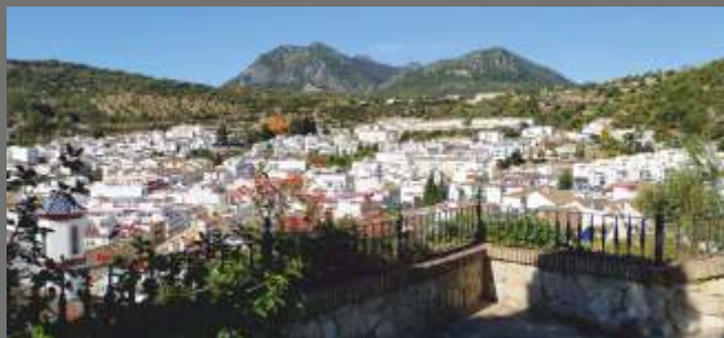
Mirador exterior de la ermita