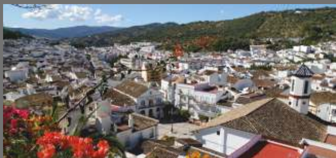
Ubrique desde el mirador