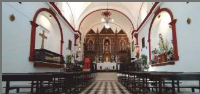
Vista interior de la ermita