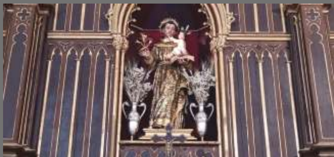
Imagen de San Antonio de Padua