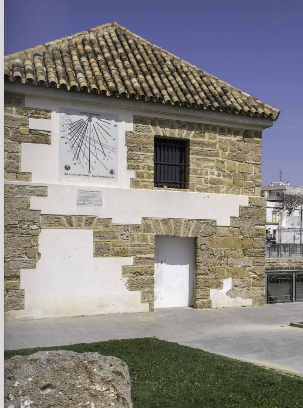
Molino de Marea El Zaporito Zaporito Tide Mills

The tide mills had great importance in the industrial development of the area over the XVII and XVIII centuries. They were destined to grind grain taking benefits from water circulation which is subject to tides. At high tide, the water is held in a kind of reservoir closed by a gate which facilitates the entry but prevents its exit. With low tide, the tide flow is directed to channels (embankments) located under the building. The wheels relayed movement to a grooved stone (volandera), which floated over another set, the grain was crushed by the friction of two stones (teeth) transforming into flour.