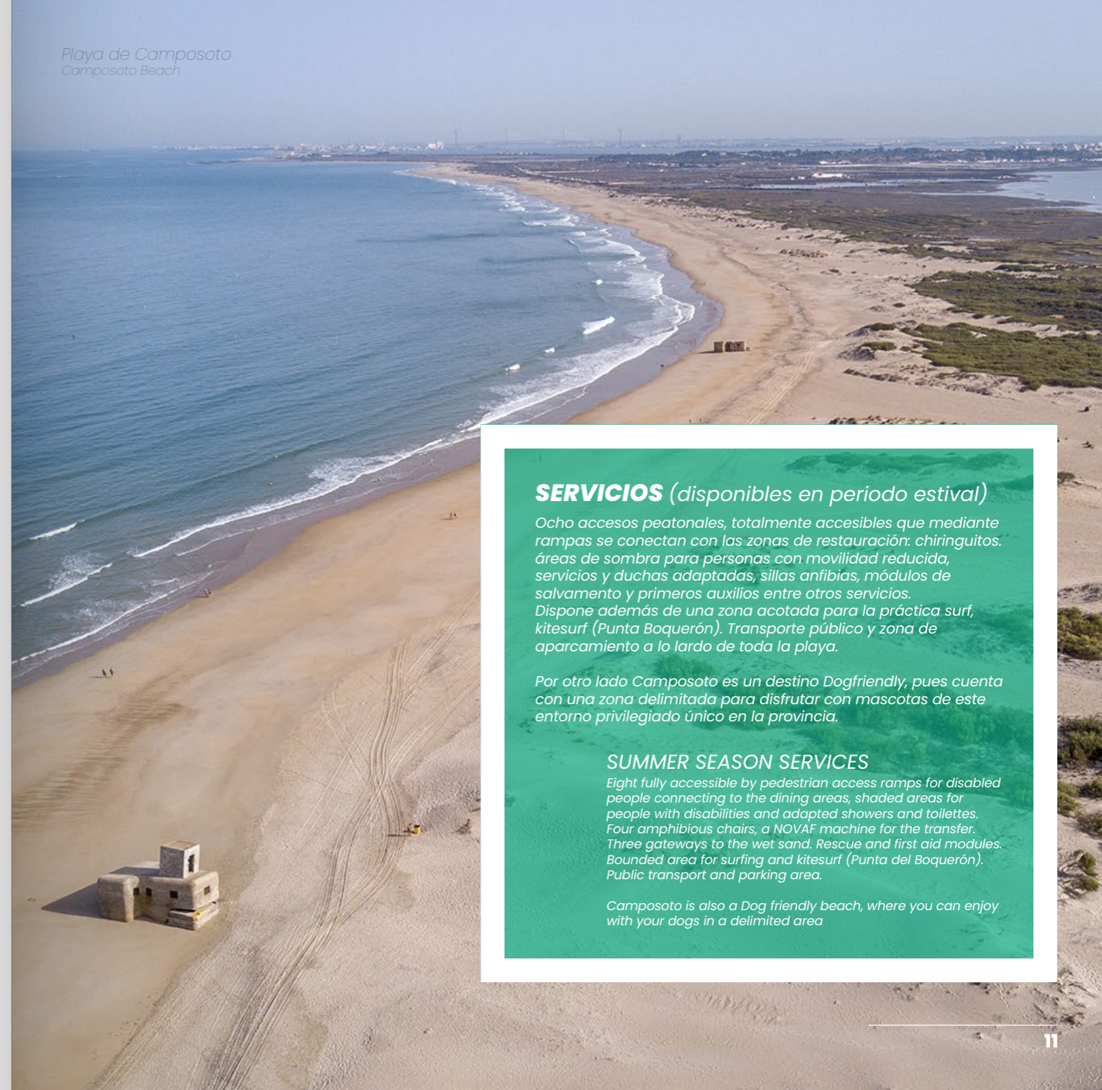
Playa de Camposoto Camposoto Beach

Our beach with its 5 kilometers along the Atlantic coastline is another of the attractions of San Fernando. It's a virgin beach integrated into the Bahía de Cádiz Natural Park. Thanks to the cleanliness of the water and its fine golden sand, this beach has been awarded with the Blue Flag for Clean Beaches in Europe. It is a beach with something for everyone, offering not only a pleasant, family environment, but also more remote, peaceful areas, where the breeze and the sea serve as companions.